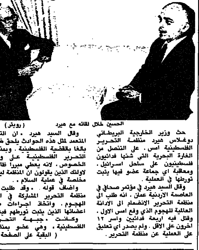
الحسين خلال لقائه مع هيرد

بحث وزير الخارجية البريطاني دوغلاس هيرد منظمة التحرير الفلسطينية امس، على التوصل من الغارة البحرية التي شنّها فدائيون فلسطينيون على ساحل اسرائيل، ومعلية اي جماعة عضو فيها يثبت تورطها في العملية. وقال السيد هيرد في مؤتمر صحافي في العاصمة الاردنية عمان، انه طلب ان منظمة التحرير المشاركة في اذانة الهجوم، واتخاذ اجراءات ضد اعضائها الذين يثبت تورطهم فيه، وقتل فيه اربعة فدائيين واس ١٢ اخرون على الاقل، وليجسروا اي تعليق على العملية عن منظمة التحرير.